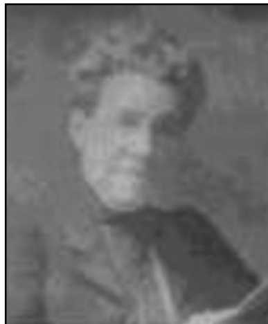
ക്രൂശിന്റെ വഴിയിലൂടെ: ജെസ്സി പെൻ ലൂയിസ്