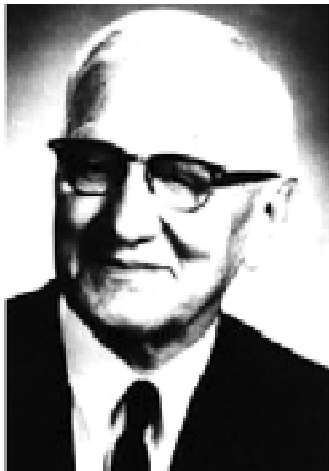
സ്റ്റാൻലി ജോൺസ്: സമ്പൂർണ്ണ സമർപ്പണത്തിന്റെ ധന്യത

ത്താനായിരുന്നു സ്റ്റാൻലിജോൺസിന് ദൈവനിയോഗം. ഒരു മാസത്തെ കപ്പൽയാത്രയ്ക്ക് ശേഷം 1907 നവംബർ 13ന് മുംബൈയിൽ എത്തുമ്പോൾ സ്വീകരിക്കാൻ ആരുമുണ്ടായിരുന്നില്ല. തുറമുഖത്ത് പരിചയപ്പെട്ട ഒരു പാഴ്സി സുഹൃത്തായിരുന്നു മുംബൈയിൽനിന്നു ലക്നൗവിലേക്കുള്ള