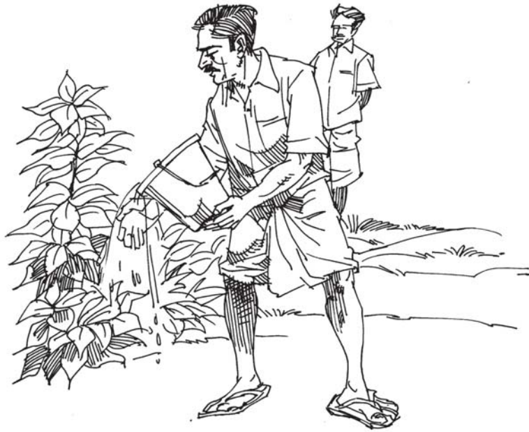
തങ്ങൾ നട്ടിടത്ത് മറ്റൊരുവൻ വന്നു വെള്ളമൊഴിച്ചാൽ അത് ഇന്നു ചില സുവിശേഷകന്മാരെ വിഷമിപ്പിക്കും.

പ്രവർത്തിക്കുന്ന വലിയ ക്രിസ്തീയ പ്രസ്ഥാനങ്ങളുടെ ഡയറക്ടർമാരായി പ്രവർത്തിച്ചും അവർ ജീവിതം പാഴാക്കുന്നു! ഇന്ത്യയിൽ ഇന്ന് ദൈവത്തിന്റെ വേല യഥാർത്ഥത്തിൽ ചെയ്തുകൊണ്ടിരിക്കുന്നത് എങ്ങനെയുള്ളവരാണ്? പുറത്തുപോയി ആളുകളെ ക്രിസ്തുവിലേക്ക് നടത്തുകയും പ്രാദേശിക സഭകളിൽ നിലനിർത്തുകയും ചെയ്യുന്നവരിൽ മിക്ക