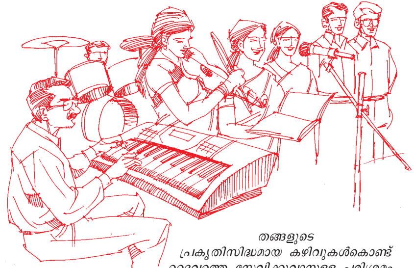
തങ്ങളുടെ പ്രകൃതിസിദ്ധമായ കഴിവുകൾകൊണ്ട് ദൈവത്തെ സേവിക്കുവാനുള്ള പരിശ്രമം ഇന്ന് ക്രിസ്തീയലോകത്തു കാണാം.

ഇന്നുവരെ ലഭിച്ചിട്ടുള്ളതിനെക്കാൾ ഉന്നതമായ ഒരു ക്രിസ്തീയാനുഭവം ദൈവം തന്റെ മക്കൾക്കായി ഒരുക്കിയിട്ടുണ്ടെന്നു വസ്തുത തിരുവെഴുത്തുകളിൽനിന്നോ മറ്റുള്ളവരുടെ സാക്ഷ്യത്തിൽനിന്നോ അവർക്കു ബോധ്യപ്പെടുകയും ചെയ്തിരിക്കുന്നു. എന്നാൽ ഈ സാഹചര്യത്തിൽത്തന്നെ