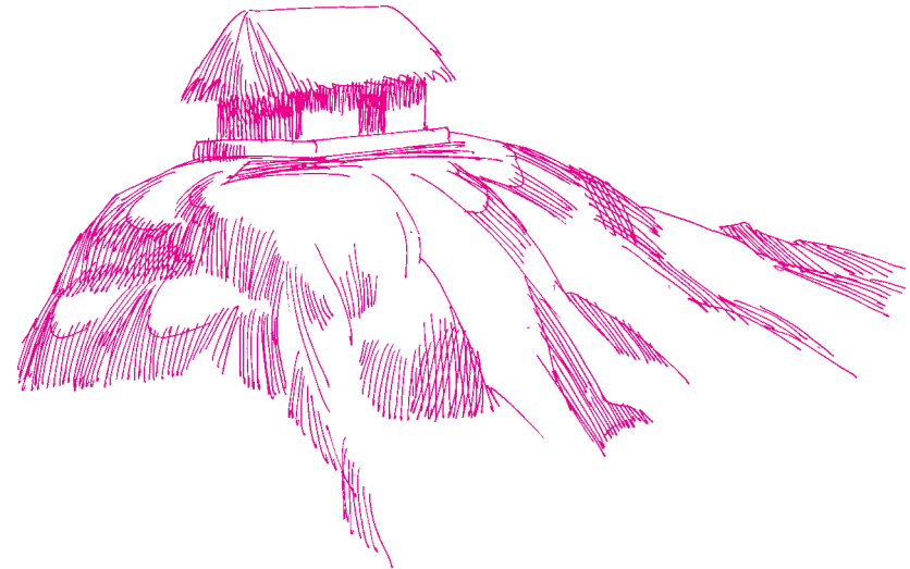
വെള്ളപ്പൊക്കത്തെ അതിജീവിച്ച വീട് പൂർണ്ണമായും അടിസ്ഥാനപ്പെട്ടിരിക്കുന്നത് എന്റേതെല്ലാം നിന്റേത് എന്ന സമ്പൂർണ്ണ സമർപ്പണത്തിന്റെ പാഠയിലാണ്.