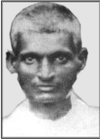
എല്ലാം ക്രിസ്തുവിനായ് സാധു കൊച്ചുകുഞ്ഞ് ഉപദേശി

വിദ്യാഭ്യാസം കഴിഞ്ഞതോടെ കൗമാരം കടന്നിട്ടില്ലാത്ത കൊച്ചുകുഞ്ഞിന് കുടുംബഭാരം പേരേണ്ടിവന്നു. പതിനഞ്ചാം വയസ്സിൽ മാതാവ് നിര്യാതയായി. പിതാവിന്റെ ആരോഗ്യം മോശമായതിനാൽ കുടുംബത്തിന്റെ ഭാരം പേറുവാൻ ആ കൗമാരപ്രായക്കാരൻ നിർബന്ധിതനായിത്തീർന്നു. കൃഷിയായിരുന്നു മുഖ്യതൊഴിൽ. സ്വന്തം പുരയിടത്തിലും പാട്ടപ്പുരയിടത്തിലും കൃഷി ഉണ്ടായിരുന്നെങ്കിലും കടുത്ത സാമ്പത്തികക്ഷേമം അന്ന് കുടുംബത്തെ തളർത്തിയിരുന്നു. നാലു പെൺമക്കളെ വിവാഹം ചെയ്തയച്ചു കഴിഞ്ഞപ്പോൾ അവശേഷിച്ചത് മുത്താമ്പാക്കൽ പുരയിടവും കുറേ കടവും മാത്രമായിരുന്നു. പഠിക്കാനുള്ള തൃഷ്ണ കെട്ടടങ്ങിയിട്ടില്ലാത്ത കൊച്ചുകുഞ്ഞ് കൃഷിപ്പണികൾക്കിടയിലും വൃക്ഷത്തണലിലിരുന്ന് പുസ്തകം വായിക്കുക പതിവായിരുന്നു. കൊച്ചുകുഞ്ഞിന്റെ ഇരുപതാമത്തെ വയസ്സിൽ പിതാവും മരണമടഞ്ഞു. ഇതിനകം ഒരു പിതാവായിക്കഴിഞ്ഞ കൊച്ചുകുഞ്ഞിന് പിന്നീട് ജീവിതം ഒരു സമരമായി മാറി. കൃഷി കൊണ്ടുമാത്രം ജീവിക്കാൻ കഴിയാതിരുന്ന കൊച്ചുകുഞ്ഞ് ചെറിയതോതിൽ തുണിക്കച്ചവടവും ആരംഭിച്ചു. ദയാശീലനായ അദ്ദേഹത്തിന് കച്ചവടത്തിലും കുറെ കടം മാത്രമാണ് അവശേഷിച്ചത്. ഇതിനിടയിൽ അടുത്തുള്ള സ്കൂളിൽ അദ്ധ്യാപകവൃത്തിയിൽ ഏർപ്പെട്ടെങ്കിലും അവിടെയും അധികനാൾ തുടർന്നില്ല.