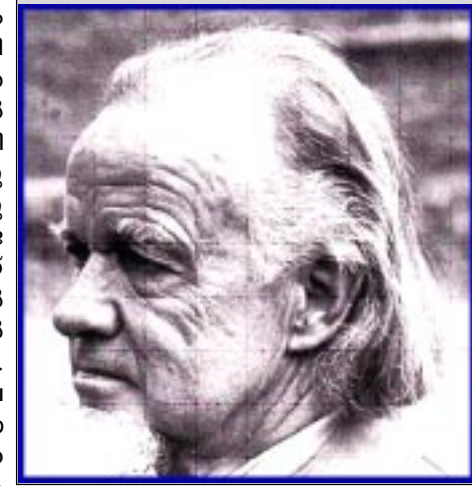
ഫ്രാൻസിസ് ഷേഫർ: സുവിശേഷകനായ ക്രിസ്തീയതത്ത്വചിന്തകൻ