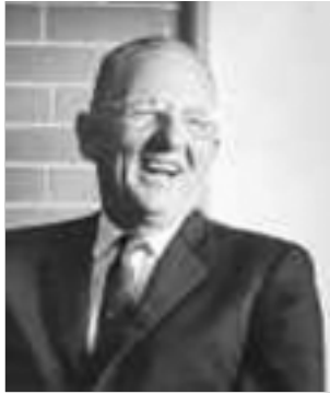
“മാതൃഭാഷയിലുള്ള ബൈബിളാണ് ഏറ്റവും വലിയ മിഷനറി” - വില്യം ടൗൺസെന്റ്

നറി കാമ്പസിൽ വന്ന് സംസാരിച്ചതിലൂടെ മിഷനറി പ്രസ്ഥാനത്തിൽ ആകൃഷ്ടനായും ചെയ്തു. പഠനകാലത്തുതന്നെ ലോസ് എഞ്ചലീസിലെ ബൈബിൾ ഹൗസ് ലാറ്റിൻ അമേരിക്കയിലേക്ക് ബൈബിൾ വിൽപ്പനയ്ക്കായി ചെറുപ്പക്കാരെ ക്ഷണിച്ചപ്പോൾ ടൗൺസെന്റ് പോകാൻ സന്നദ്ധതപ്രകടിപ്പിച്ചു. ബൈബിൾ ഹൗസ് ഈ ചെറുപ്പക്കാരനെ ഗോട്ടിമാലയിലേക്കാണ് അയച്ചത്. കോളജിലെ മറ്റൊരു സ്നേഹിതനോടൊപ്പം 1917 ൽ മദ്ധ്യ അമേരിക്കയിലെ ഗോട്ടിമാലയിലേക്ക് അദ്ദേഹം യാത്രയായി. ഗോട്ടിമാലയിൽ ബൈബിൾ വില്ക്കുന്നത് അർത്ഥപൂർണ്ണമായ ഒരു ശുശ്രൂഷയാണെന്ന് ടൗൺസെന്റിനു തോന്നി. പക്ഷേ സ്പാനിഷ് ഭാഷയിലുള്ള ബൈബിൾ തദ്ദേശവാസികളായ കാക്ചിക്കൽ ഇൻഡ്യാക്കാർക്ക് വായിക്കുവാൻ കഴിയില്ലായിരുന്നു. അവരുടെ മാതൃഭാഷയ്ക്കകളെ ലിപികളും ഇല്ലായിരുന്നു. സ്പാനിഷ് ഭാഷയിലുള്ള ബൈബിൾ നാട്ടുകാർക്ക് വില്ക്കാൻ ശ്രമിക്കുന്ന ടൗൺസെന്റിന്റെ ഉത്സാഹം ചിലർക്ക് പരിഹാസ്യമായിത്തോന്നി. ഒരു നാട്ടുകാരൻ ഈ ചെറുപ്പക്കാര