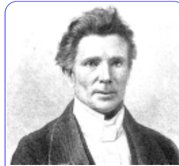
അലക്സാണ്ടർ ഡഫ്: ഉന്നതവിളിയുമായി ഉന്നതകുലജാതരുടെ മധ്യത്തിൽ.

ശേഷം സ്കോട്ട്ലന്റിനിലേക്ക് മടങ്ങുമ്പോൾ ഇളയമകന് 11 വയസ്സായിരുന്നു. ദൈവം തന്നെ ഏല്പിച്ച മിഷനറിദൗത്യത്തിനായി കുഞ്ഞുങ്ങൾക്ക് ബാല്യത്തിൽ ലഭിക്കേണ്ടിയിരുന്ന പരിചരണവും ശിക്ഷണവും നൽകാൻ കഴിയാതിരുന്ന ഡഫ് ദമ്പതിമാരുടെ ധർമ്മസങ്കടം നാം മനസ്സിലാക്കണം.