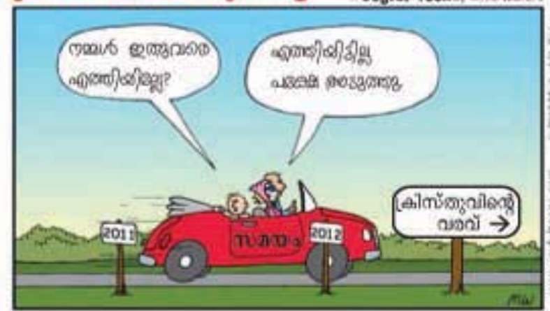
നിങ്ങളും ദീർഘകാലമായിരിക്കണം; നിങ്ങളുടെ ഹൃദയം സ്ഥിരമാക്കുവിൻ; കർത്താവിന്റെ പ്രത്യക്ഷത സമീപിച്ചിരിക്കുന്നു (യാക്കോബ് 5:8)