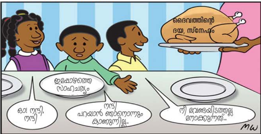
'യഹോവയെ സ്തുതിപ്പിൻ; അവൻ നല്ലവനല്ലോ അവന്റെ ദയ എന്നേക്കുമുള്ളത്' (സങ്കീർത്തനം 106:1)