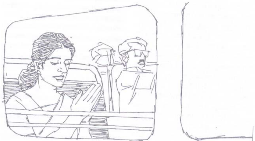
ആത്മീയ ജീവിതം പരിശുദ്ധാത്മാവിന്റെ ശക്തിയാൽ ആരോഗ്യമുള്ളതായിരിക്കുമ്പോൾ പ്രാർത്ഥന സ്വാഭാവികമായി സംഭവിക്കുന്നു.

ഇടവിടാതെ പ്രാർത്ഥിക്കുക: ഫലസിദ്ധി ഉണ്ടാകുന്നതു വരെ നിരന്തരം പ്രാർത്ഥനയിൽ നിന്നു പിടിവിടാതെ കഴിയുന്നതാണോ, അതോ ദിവസം മുഴുവൻ