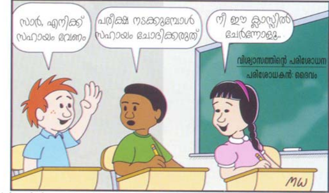
'നിങ്ങളിൽ ഒരുത്തന് ഉത്താനം കുറവാകുന്നുവെങ്കിൽ ഭത്സിക്കാതെ എല്ലാവർക്കും ഔദാര്യമായി കൊടുക്കുന്നവനായ ദൈവത്തോട് യാചിക്കട്ടെ. അപ്പോൾ അവന് ലഭിക്കും' (യാക്കോബ് 1:5)