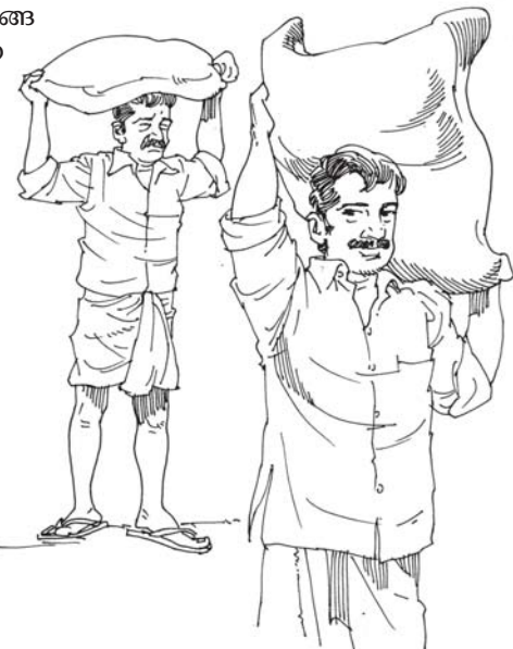
ഗത്യന്തരമില്ലാതെ കല്പന അനുസരിക്കുന്ന അടിമയുടെ അനുസരണവും, സ്നേഹാമുഖം ഉത്സാഹത്തോടെ പിതാവിനെ അനുസരിക്കുന്ന പ്രായപൂർത്തിയായ മകന്റെ അനുസരണവും തമ്മിൽ വളരെ വ്യത്യാസമുണ്ട്.

പഴയനിയമകാലത്ത് തിരുവചന സംബന്ധമായ ഒരു പ്രസിദ്ധീകരണം ഉണ്ടായിരുന്നെങ്കിൽ അതിൽ പല നല്ല കാര്യങ്ങളും വായിക്കാൻ സാധിക്കുമായിരുന്നു. എന്നാൽ ആ നല്ല കാര്യങ്ങളുടെയെല്ലാം പ്രേരകശക്തി “നീ ചെയ്യരുത്...” “നിനക്കു ചെയ്യാം” എന്നുള്ള പ്രമാണം ആയിരുന്നേനെ. എന്നാൽ പുതിയ ഉടമ്പടിയിൽ