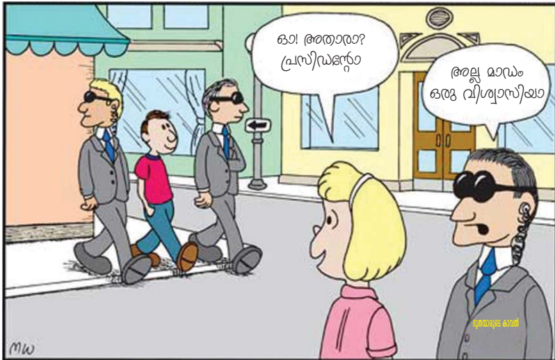
നിന്റെ എല്ലാ വഴികളിലും നിന്നെ കാക്കേണ്ടതിന് അവൻ നിന്നെക്കുറിച്ചു തന്റെ ദൂതന്മാരോടു കല്പിക്കും. സങ്കീ. 91:11