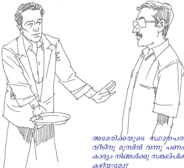
അമേരിക്കയുടെ സ്ഥാനപതി നിങ്ങളുടെ വീടിനു മുമ്പിൽ വന്നു പണം ചോദിക്കുന്ന കാര്യം നിങ്ങൾക്കു സങ്കല്പിക്കുവാൻ തന്നെ കഴിയുമോ?

പേരും നേടണമെന്നുള്ളതാണ്. മാനസാന്തരപ്പെട്ടു കഴിഞ്ഞപ്പോൾ പൗലോസിനും ഒരു അഭിലാഷമുണ്ടായി. “ശരീരത്തിൽ വസിച്ചാലും ശരീരം വിട്ടാലും കർത്താവിനെ പ്രസാദിപ്പിക്കുകയാണ് ഞങ്ങളുടെ ജീവിത ലക്ഷ്യം” (5:9). താൻ സ്വർഗ്ഗത്തിൽ എത്തിയാലും തന്റെ അഭി