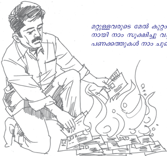
മറ്റുള്ളവരുടെ മേൽ കുറ്റം ആരോപിക്കുവാനായി നാം സൂക്ഷിച്ചു വെച്ചിട്ടുള്ള കുറ്റാരോപണക്കത്തുകൾ നാം ചൂട്ടെരിച്ചു കളയണം.

ശേഷം അവനു സർവ്വോന്നതവും നിരന്തരവുമായ സന്തുഷ്ടി നൽകുവാൻ വേണ്ടിയാണ് അവിടുന്ന് നിയമങ്ങൾ ഉണ്ടാക്കിയത്. ആറാം ദിവസത്തിന്റെ അവസാനത്തിൽ ദൈവം ആദാമിനെ സൃഷ്ടിച്ചു. അങ്ങനെ ഏഴാം ദിവസം അഥവാ ശബ്ദത്ത് മനുഷ്യന്റെ ദിവസത്തിലെ ആദ്യ ദിവസമായിത്തീർന്നു. ആദാമിന് ഒരു ശബ്ദത്തു ലഭിക്കുന്നതിനു മുമ്പ് ആറു ദിവസം വേല ചെയ്യേണ്ടി വന്നില്ല. ദൈവം തന്റെ ദയയിൽ ആറു ദിവസം