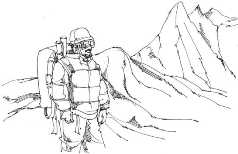
ജീവിതാവസാനം വരെ പർവ്വതത്തിൽ ചുവട്ടിൽ കഴിയാനുള്ളവരല്ല നാം. നമുക്കു മുകളിലേക്കു പ്രയാണം ചെയ്യേണ്ടതുണ്ട്.

2:14ൽ 'എല്ലാം പിറുപിറുപ്പും വാദവും കൂടാതെ ചെയ്തീൻ' എന്നു പ്രബോധിപ്പിക്കുന്നു. ഇതൊരു അസാധ്യമായ നിലവാരമെന്നു പലരും കരുതുന്നതിനാൽ ഈ കല്പനയെ അവഗണിക്കാറാണു പൊതുവേ പതിവ്. എന്നാൽ ദൈവശക്തിയാൽ ഇതൊക്കെ സാധ്യമാണ്. ഇതിനു തൊട്ടു മുമ്പുള്ള 13-ാം വാക്യം