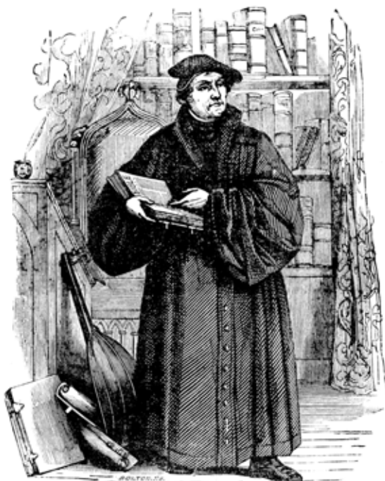
ലൂഥർ ഒരു നവീകരണത്തിന്റെ ആവശ്യതയെപ്പറ്റി പ്രസംഗിക്കുവാൻ തുടങ്ങി.

ഒരു പ്രസംഗപരമ്പര അദ്ദേഹം ആരംഭിച്ചു. പഠനത്തിനിടയിൽ സങ്കീർത്തനം 71:2-ലെ “നിന്റെ നീതി നിമിത്തം എന്നെ ഉദ്ധരിച്ചു വിടുവിക്കേണമേ” എന്ന വാക്യം തന്റെ ശ്രദ്ധയിൽപ്പെട്ടു. ദൈവിക നീതിയെന്നത് ന്യായവിധിയെയാണ് വിടുതലിനെയല്ല സൂചിപ്പിക്കുന്നത് എന്നാണ് ലൂഥർ അനുവരെ മനസ്സിലാക്കിയിരുന്നത്. ‘ദൈവത്തിന്റെ നീതി’ എന്ന വിഷയത്തെപ്പറ്റി തുടർന്ന് അദ്ദേഹം പഠനം തുടർന്നു. ദൈവികമായ ഒരു നടത്തിപ്പ് പോലെ തുടർന്നുള്ള പഠനം റോമാലേഖനത്തെപ്പറ്റി ആയിരുന്നു. റോമർ 1:16 -17 വചനങ്ങൾ ലൂഥർ