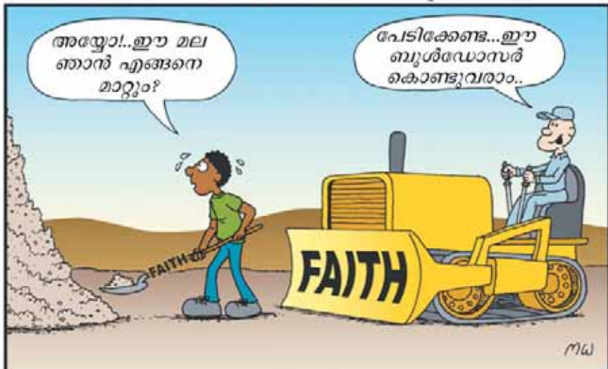
മലകളെ നീക്കുവാൻ തക്ക വിശ്വാസം..... (1 കൊരിന്ത്യർ 13:2)

www.joyfultoons.com © 2008 Michael D. Waters