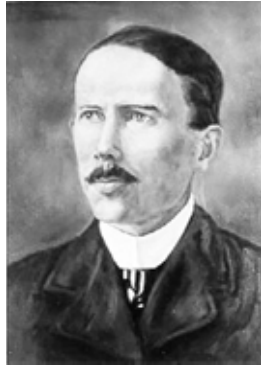
ജോൺ ഹൈഡ് ഇന്ത്യയെ സ്നേഹിച്ച പ്രാർത്ഥനയുടെ അപ്പോസ്തലൻ

ഒടുവിൽ ജോൺ ഇന്ത്യയിലേക്ക് മിഷനറി യാത്ര ആരംഭിക്കുന്ന സുദിനം വന്നുചേർന്നു. ന്യൂയോർക്കിൽനിന്നുമുള്ള കപ്പൽ യാത്ര തുടങ്ങുന്നതിനുമുമ്പ് ജോണിനെ യാത്രയാക്കാൻ അദ്ദേഹത്തിന്റെ പിതാവിന്റെ സ്നേഹിതനും എത്തിയിരുന്നു. പിതാവിന്റെ സ്നേഹിതൻ ഒരു മിഷനറിയാകാൻ ഒരിക്കൽ വളരെ ആഗ്രഹിച്ചതാണ്. എന്നാൽ അദ്ദേഹത്തിന്റെ ആഗ്രഹം ഒരിക്കലും പൂർണ്ണമായില്ല. ഇപ്പോഴാകട്ടെ അദ്ദേഹത്തിന്റെ പ്രിയ സുഹൃത്തിന്റെ മകൻ ആ യത്നം ഏറ്റെടുത്തിരിക്കുന്നു. അദ്ദേഹം വളരെയധികം സന്തോഷിച്ചു. ജോണും അദ്ദേഹത്തെ വളരെയധികം ബഹുമാനിച്ചിരുന്നു. യാത്രപറഞ്ഞ ശേഷം അദ്ദേഹം ജോണിന് ഒരു കുറിപ്പ് കൈമാറി. കപ്പൽ മുന്നോട്ട് നീങ്ങി തുടങ്ങിയപ്പോൾ ജോൺ തന്റെ ക്യാബിനിലിരുന്ന് ആ കുറിപ്പെടുത്ത് ഇങ്ങനെ വായിച്ചു. “പ്രിയപ്പെട്ട ജോൺ, നീ പരിശുദ്ധാത്മാവിനാൽ നിറയപ്പെടുന്നതുവരെ ഞാൻ നിനക്ക് വേണ്ടി പ്രാർത്ഥിച്ചുകൊണ്ടിരിക്കും.” ഇതായിരുന്നു ആ കുറിപ്പിൽ എഴുതിയിരുന്നത്. കുറിപ്പ് വായിച്ച ജോണിന് ഒരടിയേറ്റപോലെ തോന്നി. ആ വാക്കുകൾ തന്റെ മിഷനറിയാകാനുള്ള യോഗ്യതയെ ചോദ്യംചെയ്യുന്നതായി അദ്ദേഹത്തിനനുഭവപ്പെട്ടു. അദ്ദേഹത്തിന് അമർഷം തോന്നി. ജോൺ ആ കുറിപ്പ് ചുരുട്ടി ക്യാബിന്റെ മൂലയിലേക്കെറിഞ്ഞു. അദ്ദേഹം എഴുന്നേറ്റ് കപ്പലിന്റെ മുകൾത്തട്ടിലേക്ക് പോയി. “ഒരു യഥാർത്ഥ മിഷനറിയായി