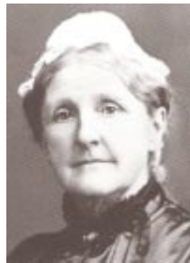
ജയജീവിതത്തിന്റെ ജിഹ്വ: ഹന്നാവിറ്റാൾസ് മിത്ത്

വിടുതൽ പ്രാപിച്ചു. അതേ വർഷം തന്നെ റോബർട്ട് പിയർസൽ സ്മിത്ത് എന്ന യുവാവ് പ്രസ്ബിറ്റേറിയൻ സഭയിലൂടെ വീണ്ടും ജനനനുഭവത്തിലേക്ക് വരുവാൻ ഇടയായി, റോബർട്ടും ഹന്നയും ദൈവികപദ്ധതിയിൽ കണ്ടുമുട്ടുകയും താമസിയാതെ വിവാഹിതരായിത്തീരുകയും ചെയ്തു. 1851 നവംബർ