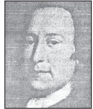
സിൻസെൻഡോർഫ്: മൊറോവിയൻ മുന്നേറ്റത്തിന്റെ ജനയിതാവ്