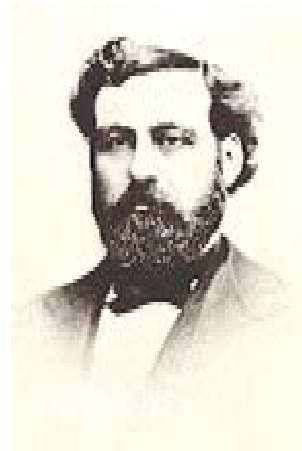
ദുഃഖസാഗരത്തിലെ പ്രത്യാശയുടെ ഈരടി... ഹൊറേഷ്യോ സ്പാഫോർഡ്

സമാന്യം ഭേദപ്പെട്ടസാമ്പത്തികസ്ഥിതി ഉണ്ടായിരുന്ന ഹൊറേഷ്യോ സ്പാഫോർഡ് സമർത്ഥനായ അഭിഭാ