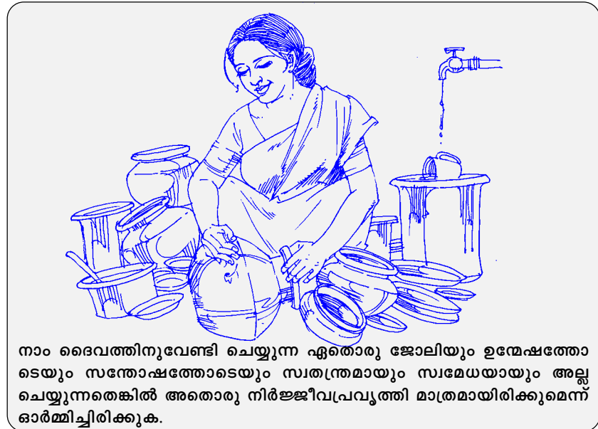
നാം ദൈവത്തിനുവേണ്ടി ചെയ്യുന്ന ഏതൊരു ജോലിയും ഉന്മേഷത്തോടെയും സന്തോഷത്തോടെയും സ്വതന്ത്രമായും സ്വമേധയായും അല്ല ചെയ്യുന്നതെങ്കിൽ അതൊരു നിർജജീവപ്രവൃത്തി മാത്രമായിരിക്കുമെന്ന് ഓർമ്മിച്ചിരിക്കുക.

സ്നേഹിക്കുന്നതു പോലെ അവരെയും സ്നേഹിക്കുന്നു”(യോഹ.17:23) ഞാൻ ബൈബിളിൽ കണ്ടെത്തിയ ഏറ്റവും മഹത്തായ സത്യം ഇതുതന്നെയാണ്. മനസ്സിടിഞ്ഞ് നിരാശനും അരിഷ്ടനുമായ ഒരു വിശ്വാസി എന്ന നിലയിൽ നിന്നും ഇതെന്ന ദൈവത്തിന്റെ കരങ്ങളിൽ സുരക്ഷിതനായ, എപ്പോഴും കർത്താവിൽ സന്തോഷമുള്ള, ഒരുവനാക്കി മാറ്റി. ദൈവം നമ്മെ സ്നേഹിക്കുന്നു എന്നു