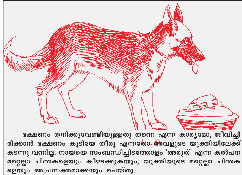
ഭക്ഷണം തനിക്കുവേണ്ടിയുള്ളതു തന്നെ എന്ന കാര്യമോ, ജീവിച്ചിരിക്കാൻ ഭക്ഷണം കൂടിയേ തീരു എന്നതോ അവളുടെ യുക്തിയിലേക്ക് കടന്നു വന്നില്ല. നായയെ സംബന്ധിച്ചിടത്തോളം ‘അരുത്’ എന്ന കൽപന മറ്റെല്ലാ ചിന്തകളെയും കീഴടക്കുകയും, യുക്തിയുടെ മറ്റെല്ലാ ചിന്തകളെയും അപ്രസക്തമാക്കുകയും ചെയ്തു.

ലൊരു സാഹചര്യത്തിൽ എങ്ങനെ പ്രതികരിക്കുമായിരുന്നു എന്ന് ഉറപ്പായിരുന്നു. കുട്ടിക്കാലത്ത് എന്തെങ്കിലും ഒരു കാര്യം ചെയ്യരുത് എന്ന പറഞ്ഞിട്ട് അമ്മ മുറിവിട്ടുപോയാൽ, അമ്മ കാണാൻ കഴിയാത്ത ദൂരത്താണ് എന്നുമാത്രം ഉറപ്പുവരുത്തിയിട്ട് ഞാൻ ആഗ്രഹിക്കുന്ന കാര്യം ചെയ്യുന്ന സ്വഭാവക്കാരനായിരുന്നു ഞാൻ!.