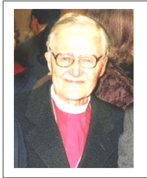
പത്രാതെ മുന്നോട്ട്: ലെസ്ലി ന്യൂബിഗിൻ

ത്തോട് ലളിതമായ ഭാഷയിൽ സുവിശേഷം പറകയും ഒരണ വിലയ്ക്ക് സുവിശേഷപ്രതികൾ കൊടുക്കുകയും ചെയ്തുവന്നു.