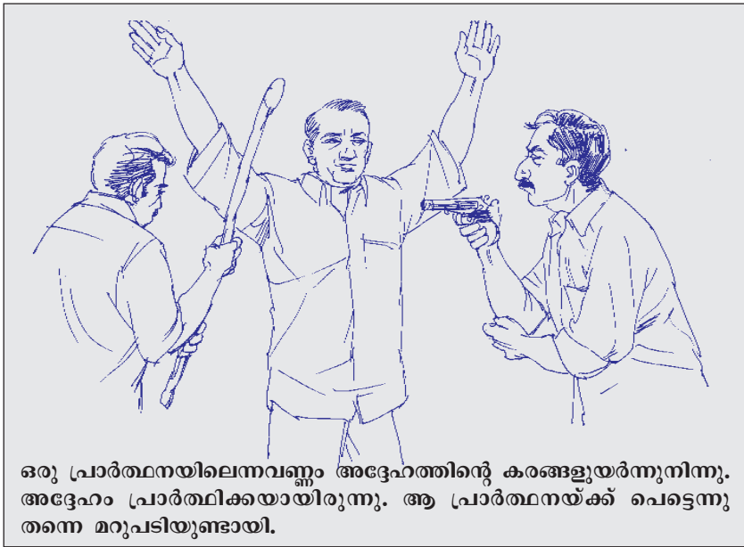
ഒരു പ്രാർത്ഥനയിലെ നവണ്ണം അദ്ദേഹത്തിന്റെ കരങ്ങളുയർന്നുനിന്നു. അദ്ദേഹം പ്രാർത്ഥനയായിരുന്നു. ആ പ്രാർത്ഥനയ്ക്ക് പെട്ടെന്നു തന്നെ മറുപടിയുണ്ടായി.

മനോഹരമായ ഒരു വീടും നല്ല ഭക്ഷണവും വിലകൂടിയ വസ്ത്രങ്ങളും മറ്റൊരു സുഖസൗകര്യങ്ങളും അനുഭവിച്ചാണ് ഞാൻ ജീവിച്ചത്. നിരവധി വന്ന വിദേശയാത്രകൾ നടത്തുവാനും ഏറ്റവും മികച്ച സംഗീതവും കലയുമൊക്കെ ആസ്വദിക്കുവാനും എനിക്ക് എല്ലായ്പ്പോഴും എല്ലാ സൗകര്യങ്ങളും ലഭിച്ചിട്ടുണ്ട്. ഇല്ലായ്മയോ പോരായ്മയോ ഏതെങ്കിലും കാര്യത്തിൽ ഞാൻ ഒരിക്കലും അനുഭവിച്ചിട്ടില്ല. “നീ ക്രിസ്തുവിനുവേണ്ടി എന്തു സഹിച്ചിട്ടുണ്ട്?” എന്ന ചോദ്യം നിരന്തരം എന്നിൽ നിന്നുയരുന്നതിനെ തടയുവാൻ കഴിയുന്നില്ല. തന്റെ നാമനുവേണ്ടി എന്തെല്ലാം സഹിക്കേണ്ടിവന്നിട്ടുണ്ടെന്ന് പൗലോസ് ഏറ്റുപറഞ്ഞിട്ടുണ്ട്. ക്രിസ്തുവിന്റെ കാൽ ചുവടുകളെ അനുഗമിക്കുക എന്നാൽ സഹനമാണെന്നു മാക്സ്വെൽ അസന്ദിഗ്ധമായി പ്രസ്താവിക്കുമ്പോൾ റെയ്മണ്ടിൽ താനെടുത്ത നിലപാടുകളും തന്റെ അനുഭവങ്ങളും സാക്ഷിനിർത്തിയാണ് പറയുന്നത്. പക്ഷേ എന്റെ ജീവിതത്തിൽ ഇതിനൊക്കെ എന്തു സ്ഥാനമാണുള്ളത്? ഒരു ശുശ്രൂഷകൻ എന്ന നിലയിലുള്ള ചെറിയ ചെറിയ അസൗകര്യങ്ങളും ശല്യങ്ങളും ഒക്കെ കഷ്ടവും പീഡയുമായി കണക്കാക്കാമോ? അപ്പോസ്തലന്മാരെയും ആദിമപിതാക്കന്മാരെയും താരതമ്യം ചെയ്യുമ്പോൾ എന്റെ ജീവിതം പാപകരമായ സുഖലോലുപതയും ആർഭാടവും നിറഞ്ഞതാണ്. എനിക്കിതുമായി ഒത്തുപോകാൻ കഴിയുന്നില്ല. ഞാൻ അവന്റെ കാൽചുവടുകളെല്ല പിന്തുടരുന്നത്. ഇന്നത്തെ ഈ സ്ഥാനവും ശുശ്രൂഷയും സഭയുടെ കെട്ടും വ്യവസ്ഥിതിയും ഒക്കെ തുടരുന്നിടത്തോളം ഇവിടെ ഇരുന്നുകോണ്ട് ഒന്നും സാധ്യമല്ല. എനിക്ക് ഈ കുറ്റബോധത്തിൽ നിന്നും മോചനമില്ല. ആവശ്യത്തിലിരിക്കുന്ന ആത്മാക്കൾക്ക് എന്നെ നൽകാതിടത്തോളം എനിക്ക് ആശ്വാസം ലഭിക്കില്ല”