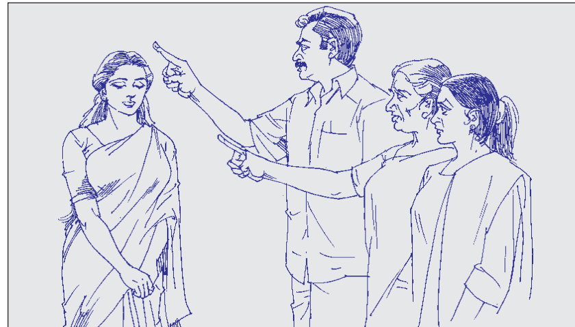
ആരുടെ കരങ്ങളാണ് നമ്മെ കൈകാര്യം ചെയ്യുന്നതെന്ന് നാം തിരിച്ചറിയണം. അതു നമ്മുടെ വീട്ടിലുള്ളവരുടേയോ സഹോദരന്മാരുടേയോ സഹോദരിമാരുടേയോ അല്ല. അതൊരു മാനുഷികകരമല്ല.

ടുന്നു വലിയ തോതിലുള്ള തകർച്ചയിലേക്കു നയിക്കുകയും ചെയ്യും. ഒന്നുകിൽ പെട്ടെന്നുള്ള ഒന്നിനെതുടർന്ന് ക്രമാനുഗതമായ തകർച്ച. അല്ലെങ്കിൽ ക്രമാനുഗതമായ നൂറുകത്തെ തുടർന്നു പെട്ടെന്നുള്ള ഒന്ന്. നമ്മിൽ നൂറുകത്തിന്റെ ഈ പ്രവൃത്തി പൂർത്തിയാക്കാൻ കർത്താവ് നിരവധി വർഷങ്ങൾ തന്നെ എടുത്തേക്കാം. നൂറുകത്തിന്റെ സമയം കർത്താവിന്റെ കരങ്ങളിലാണ്. നൂറുകൾ ഉണ്ടാക്കാ