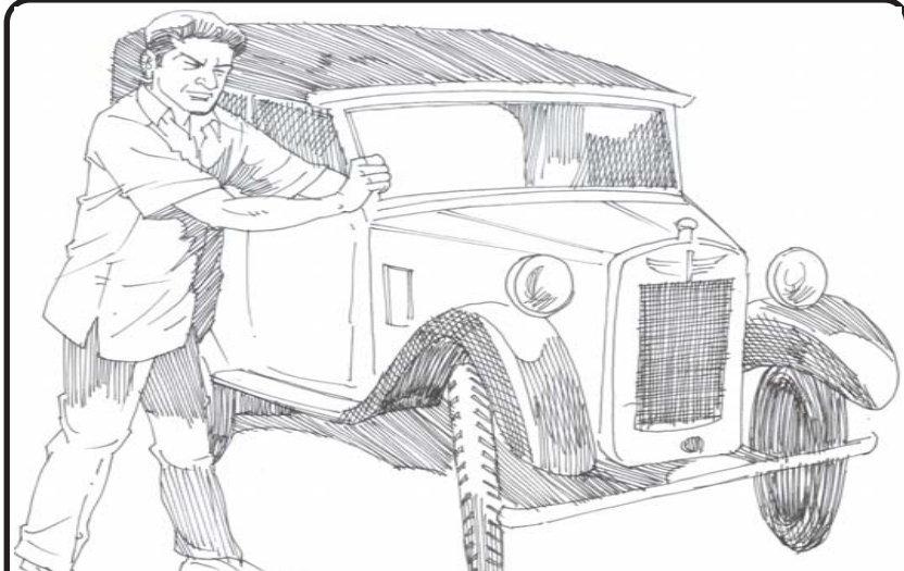
സ്വാർത്ഥത്തിനുവേണ്ടിയോ ചുമതല തീർക്കുന്ന മനോഭാവത്തിലോ ദൈവത്തെ സേവിക്കുന്നത് കാരിന്റെ ചക്രം ഘടിപ്പിച്ചിരിക്കുന്ന സ്ഥാനത്ത് എണ്ണയ്ക്ക് പകരം മണൽ വാരിയിട്ട് ഓടിക്കാൻ ശ്രമിക്കുന്നതു പോലെയാണ്.

ണ്ടിയോ ചുമതല തീർക്കുന്ന മനോഭാവത്തിലോ ദൈവത്തെ സേവിക്കുന്നത് മുഷിപ്പൻ പണിയായിരിക്കും. കാരിന്റെ ചക്രം ഘടിപ്പിച്ചിരിക്കുന്ന സ്ഥാനത്ത് എണ്ണയ്ക്ക് പകരം മണൽ വാരിയിട്ട് ഓടിക്കാൻ ശ്രമിക്കുന്നതു പോലെയാണ്. വണ്ടി മുമ്പോട്ടുവെക്കുവാൻ ശ്രമിക്കുമ്പോൾ അതു ശബ്ദമുണ്ടാക്കുകയും മുമ്പോട്ടു നീങ്ങാൻ വിസമ്മതിക്കുകയും ചെയ്യും. നിർഭാഗ്യവശാൽ ഇതു നമ്മിൽ പലരുടെയും ജീവിതത്തിന്റെ ഒരു ചിത്രമാണ്. എന്നാൽ മണൽ വാരിക്കളഞ്ഞ് നന്നായി എണ്ണയിട്ട് കഴിയുമ്പോൾ വണ്ടി എത്ര സുഗമമായും ശബ്ദരഹിതമായും വേഗത്തിലും ഓടുന്നു എന്നു നോക്കുക.