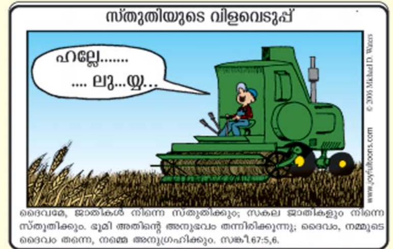
ദൈവഭക്ത, ജാതകങ്ങൾ നിന്നെ സ്തുതിക്കും; സകല ജാതികളും നിന്നെ സ്തുതിക്കും. ഭൂമി അതിന്റെ അനുഭവം തന്നിരിക്കുന്നു; ദൈവം, നമ്മുടെ ദൈവം അന്നെ, നമ്മെ അനുഗ്രഹിക്കും. സങ്കീ. 67:5,6.

One scientist estimated that our brain, on the average, processes over 10,000 thoughts and concepts each day-and some people process a much greater number.