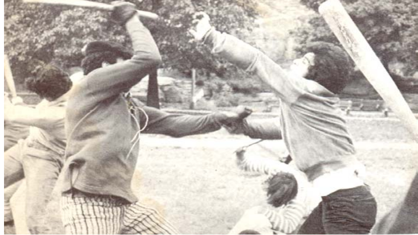
ഭ്രാന്തു പിടിക്കുമ്പോൾ ശത്രുവോ മിത്രമോ എന്നു നോക്കാതെ ആരെയും ഞാൻ അടിച്ചുവീഴ്ത്തിക്കളയും

ത്താൻ കഴിയും? ഞാൻ അറിയാൻ ആഗ്രഹിച്ചു. സുവിശേഷകനാകുന്നതിനെക്കുറിച്ച് അവൻ എന്നാണ് പറഞ്ഞത്? ആരോടാണവൻ പറഞ്ഞത്? ഇതിനൊന്നും ആ കുട്ടിക്കു മറുപടി ഉണ്ടായിരുന്നില്ല. അതുകൊണ്ട് അവനെ വിട്ട് ഞാൻതന്നെ നിക്കിയെ തെരയുവാൻ തുടങ്ങി.