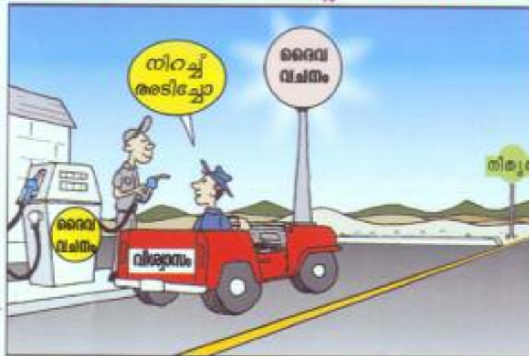
വിശ്വാസം കേൾവിയാണെന്നും കേൾവി ക്രിസ്തുവിന്റെ വചനത്താണെന്നും വരുന്നു. (റോമർ 10:17)