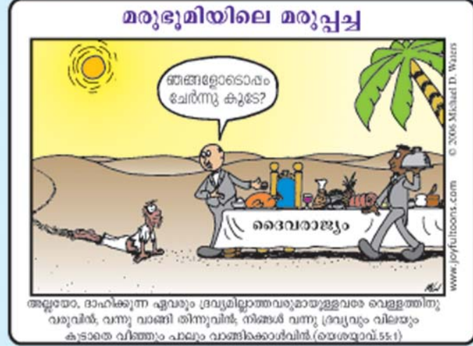
അല്ലാഹും, ദാഹിക്കുന്ന ഏവരും ദ്രവ്യമില്ലാത്തവരും മരുഭൂമിയിലെ വെള്ളത്തിനു വരുവീൽ, വന്നു വാണി തിന്നുവിൻ; നിങ്ങൾ വന്നു ദ്രവ്യവും വിഭവവും കൂടാതെ വീഞ്ഞും പാലും വാങ്ങിക്കൊൾവിൻ. (മദശ്ശോബ്.55:1)

The brain's sophistication has also prompted prolific science writer(and evolutionist)Issac Asimov to acknowledge that "in Man is a three pound brain which, as far as we know, is the most complex and orderly arrangement of matter in the universe."