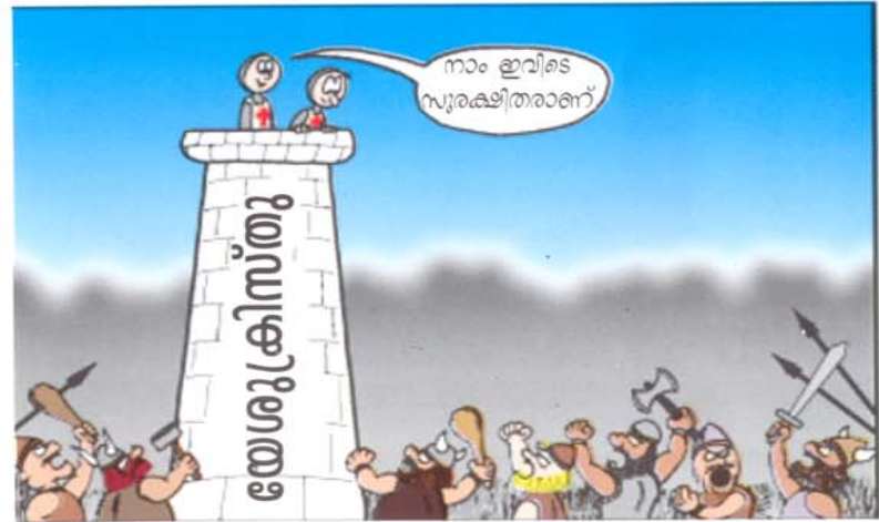
യഹോവയുടെ നാമം ബലമുള്ള ഗോപുരം; നീതിമാൻ അതിലേക്ക് ഓടിച്ചെന്ന് അഭയം പ്രാപിക്കുന്നു. (സദുശവാക്യങ്ങൾ 18:10)

© 2007 Michael D. Waters www.joyfultoons.com