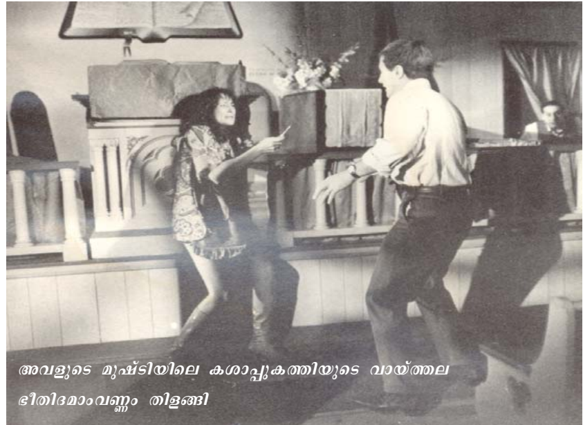
അവളുടെ മുഷ്ടിയിലെ കശാപ്പുകത്തിയുടെ വായ്ത്തല ഭീതിദമാവണം തിളങ്ങി

പെട്ടെന്ന് മീറ്റിംഗിന്റെ പുറകുഭാഗത്തായി ഒരു ചെറിയ ബഹളം. ഒരു മനുഷ്യൻ ചാടി എഴുന്നേറ്റ് എന്തോ വിളിച്ചു