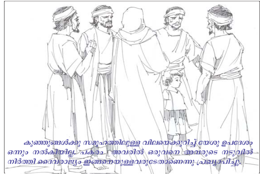
കുഞ്ഞുങ്ങൾക്കു സമുഹത്തിലുള്ള വിലയെക്കുറിച്ച് യേശു ഉപദേശം ഒന്നും നൽകിയില്ല. പകരം അവരിൽ ഒരുവനെ അമ്പലമുക്ക് നടുവിൽ നിർത്തി ദൈവരാജ്യം ഇങ്ങനെയുള്ളവരുടേതാണെന്നു പ്രഖ്യാപിച്ചു.

യിൽ നിന്ന് യേശുവിനെ മോചിപ്പിച്ചു പുറത്തുകൊണ്ടുവന്നാൽ ആ യേശു ഭാരതീയർക്കു സ്വീകാര്യനായിരിക്കുമെന്നാണു സ്റ്റാൻലി ജോൺസ് വിവക്ഷിച്ചത്.