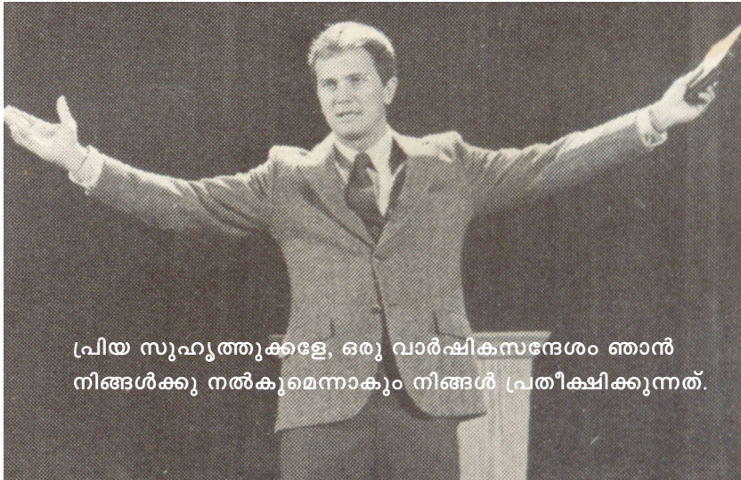
പ്രിയ സുഹൃത്തുക്കളേ, ഒരു വാർഷികസന്ദേശം ഞാൻ നിങ്ങൾക്കു നൽകുമെന്നാകും നിങ്ങൾ പ്രതീക്ഷിക്കുന്നത്.

എന്നാൽ തുടർ പ്രവർത്തനം എന്നാൽ മാനസാന്തരപ്പെടുന്നവരെ വിട്ടുകളയാതെ ശ്രദ്ധിച്ച് അവരോടൊപ്പം രംഗത്ത് നിൽക്കുക എന്നതാണ്. ജീവിത