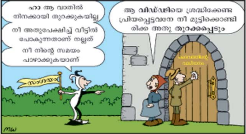
യാചിപ്പിൻ എന്നാൽ നിങ്ങൾക്കു കിട്ടും; അതാചിപ്പിൻ എന്നാൽ നിങ്ങൾ കടന്നുപോകും; മുട്ടുവിൻ എന്നാൽ നിങ്ങൾക്കു തുറക്കും. (മത്താ.7:7)