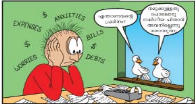
www.joyfulcartoons.com © 2007 Michael D. Waters

ആകാശത്തിലെ പറവകളെ നോക്കൂവിൻ... സ്വർഗസ്ഥനായ നിങ്ങളുടെ പിതാവ് അവയെ പൂലർത്തുന്നു. അവയെക്കാൾ നിങ്ങൾ ഏറ്റവും വിശേഷതയുള്ളവരല്ലേയോ? (മത്താ. 6:26)