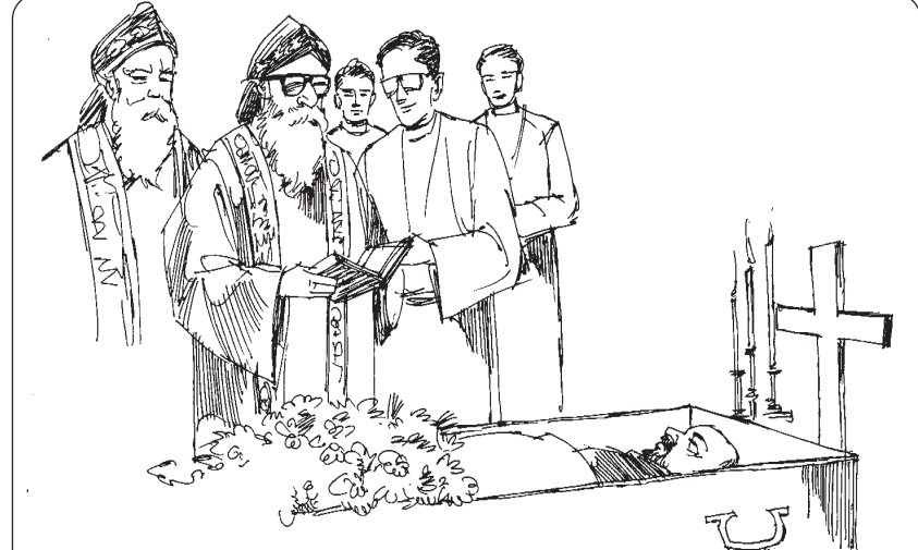
ധനവാൻ വലിയ ഒരു ശവസംസ്കാരം തന്നെ ലഭിച്ചിരിക്കാം. മഹാപുരോഹിതൻ തന്നെ അതിനു മുഖ്യ കാർമ്മികത്വം വഹിച്ചിരിക്കാം.

ലാസർ മരിച്ചപ്പോൾ അവനുശവസംസ്കാരം ലഭിച്ചോ എന്നൊന്നും ബൈബിൾ പറയുന്നില്ല (16:22) ഒരു പക്ഷേ ആ മൃതദേഹം ചവറ്റുകുനയിലേക്ക് എറിഞ്ഞു കളഞ്ഞിരിക്കാം. എന്നാൽ പറുദീസയിലെത്തിയ ലാസറിനു അക്കാര്യത്തിൽ എന്തു പേദം? ധനവാൻ വലിയ ഒരു ശവസംസ്കാരം തന്നെ ലഭിച്ചിരിക്കാം. മഹാപുരോഹിതൻ തന്നെ അതിനു മുഖ്യ കാർമ്മികത്വം വഹിച്ചിരിക്കാം. (മതനേതാക്കന്മാർ ധനവാന്മാരുടെ ശവസംസ്കാരത്തിനാണല്ലോ പോകാറു പതിവ്) അങ്ങനെയെങ്കിൽ വളരെ പ്രശംസകൾ ധനവാനെക്കുറിച്ച് അദ്ദേഹം പറയുകയും ചെയ്തിരിക്കാം. പക്ഷേ ഇത്തരം ശവസംസ്കാരം നടക്കുമ്പോൾ അയാൾ നരകത്തിലെത്തിക്കഴിഞ്ഞു! അവിടെ കിടന്നുകൊണ്ട് ഇതിനൊക്കെ സാക്ഷ്യം വഹിച്ചു. ചില ആളുകൾ വലിയ ഒരു ശവസംസ്കാരവും വിവാഹവും ലഭിക്കാൻ വേണ്ടി മാത്രമാണ് നിർജ്ജീവമായ തങ്ങളുടെ സമുദായങ്ങളെയും കത്തീഡ്രലുകളെയും വിടാതെ ഗാഢമായി