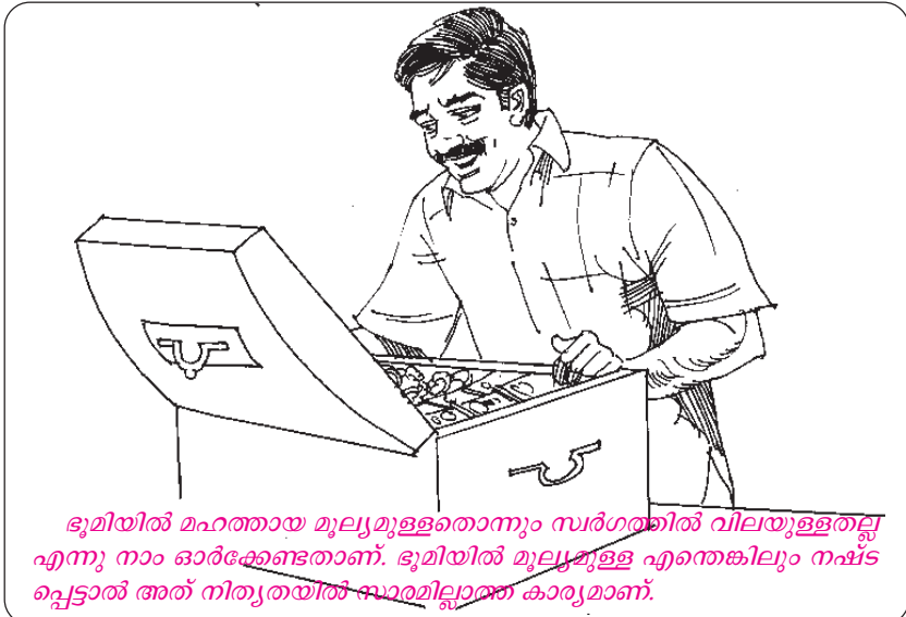
ഭൂമിയിൽ മഹത്തായ മൂല്യമുള്ളതൊന്നും സ്വർഗത്തിൽ വിലയുള്ളതല്ല എന്നു നാം ഓർക്കേണ്ടതാണ്. ഭൂമിയിൽ മൂല്യമുള്ള എന്തെങ്കിലും നഷ്ടപ്പെട്ടാൽ അത് നിത്യതയിൽ സാരമില്ലാത്ത കാര്യമാണ്.