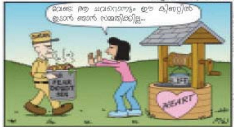
സകലജാഗ്രതയോടുംകൂടെ നിന്റെ പുറയത്തെ കാര്യങ്ങൾക്കു; ജീവന്റെ ഉത്സവം അതിൽനിന്നല്ലോ ആകുന്നത്. (സുഖ, 4:25)