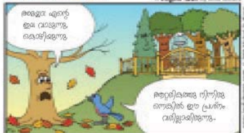
'അവൻ ആറ്റി കരുതു നട്ടിരിക്കുന്നതും..... ഇല വാടാത്തതുമായ വൃക്ഷം പോലെയിരിക്കും.' (സങ്കീർത്തനം 1:3)