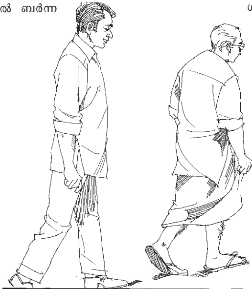
നിങ്ങൾ ചെറുപ്പക്കാരനാണെങ്കിൽ ദൈവത്താൽ നിയമിക്കപ്പെട്ട ഒരു നേതാവ് നിങ്ങൾക്കു വഴികാട്ടിയായി ഉണ്ടായിരിക്കണം.

ബാസിനെപ്പോലെ സ്വഭാവഗുണമുള്ള തിമൊഥെയോസ് എന്ന ഉത്തമനും ചെറുപ്പക്കാരനുമായ ശിഷ്യനെ ദൈവം പൗലോസിനു കൊടുക്കുന്നു. ഇവിടെ പൗലോസ് ചെയ്ത വേറെ ഒരു തെറ്റ് നാം കാണുന്നു. അദ്ദേഹം യെഹൂദന്മാരെ പ്രസാദിപ്പിക്കാൻ തിമൊഥെയോസിനെ പരിചേരുന്ന കഴിപ്പിച്ചു. പിന്നീടു പൗലോസിന് ഈ വിഷയത്തിൽ വെളിച്ചം ലഭിക്കുകയും പരിചേരുന്ന അനാവശ്യമാണ് എന്നദ്ദേഹം പറയുകയും ചെയ്തു. (ഗലാ: 5:2, 3) പക്ഷേ അപ്പോസ്തലന്മാർ പഴയ നിയമത്തിനും പുതിയനിയമത്തിനും ഇടയ്ക്കുള്ള ഒരു പരിവർത്തനദശയിലായിരുന്നു. അതിനാൽ