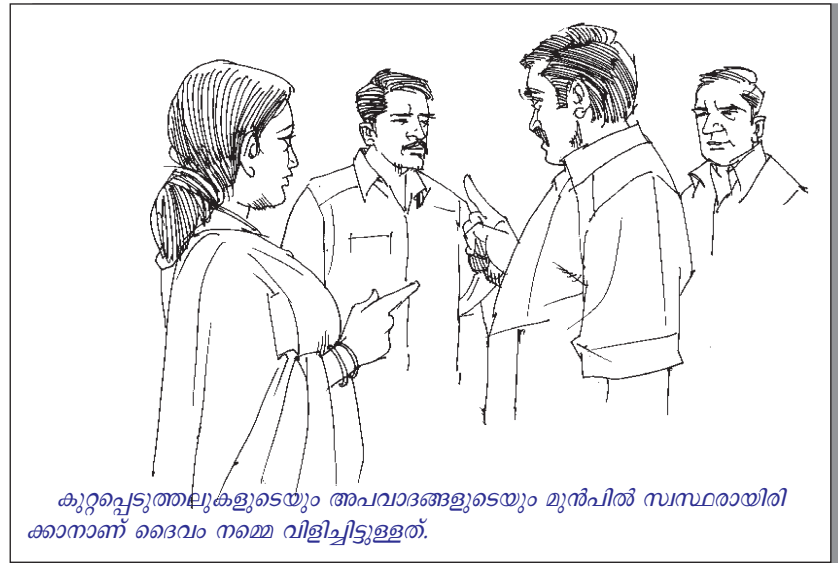
കുറ്റപ്പെടുത്തലുകളുടെയും അപവാദങ്ങളുടെയും മുൻപിൽ സ്വസ്ഥരായിരിക്കാനാണ് ദൈവം നമ്മെ വിളിച്ചിട്ടുള്ളത്.

സകല മനുഷ്യരുടെയും മുമ്പിൽ നാം ക്രിസ്തുവിന്റെ സാക്ഷികളായിരിക്കേണ്ടതാണെന്നു നമുക്കറിയാം. എന്നാലിവിടെ ദുഷ്ടാത്മസമൂഹത്തിനും നാം ഒരു സാക്ഷ്യം നൽകുവാനുള്ളതായി പ്രസ്താവിച്ചിരിക്കുന്നു. ഈ സാക്ഷ്യം എന്താണ്? ദൈവത്തിന്റെ ബഹുവിധമായ അനാഥതെക്കുറിച്ചുള്ള ഒരു സാക്ഷ്യമത്രേ ഇത്