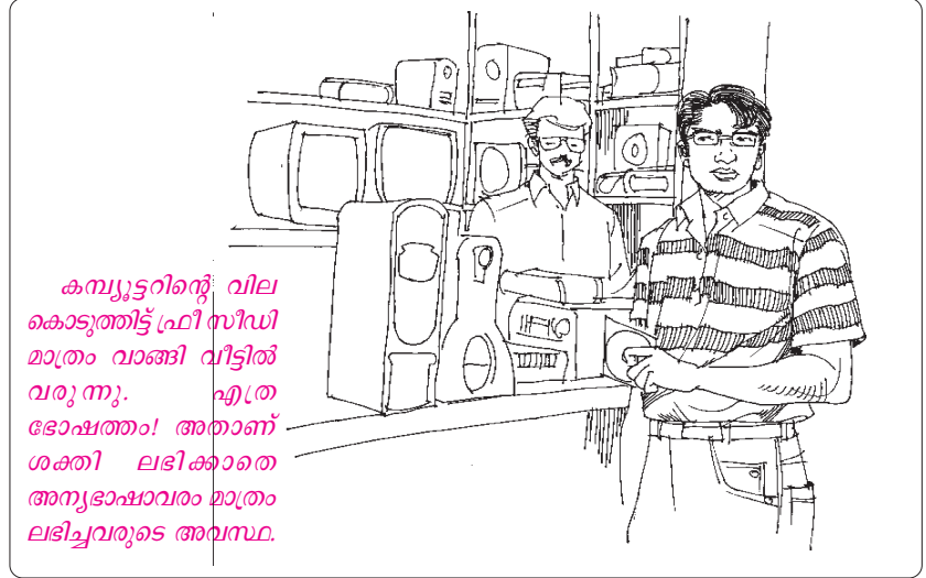
കമ്പ്യൂട്ടറിന്റെ വില കൊടുത്തിട്ട് ഫ്രീ സീഡി മാത്രം വാങ്ങി വീട്ടിൽ വരുന്നു. എത്ര ഭോഷത്തം! അതാണ് ശക്തി ലഭിക്കാതെ അന്യഭാഷാപരമാത്രം ലഭിച്ചവരുടെ അവസ്ഥ.

ആ കാത്തിരുന്ന ശിഷ്യന്മാരുടെ അടുക്കൽ നിങ്ങൾ പോയി 'ആത്മാവിനാൽ നിറയപ്പെടുന്നത് എങ്ങനെ നിങ്ങൾ അറിയും?' എന്നു ചോദിച്ചാൽ, 'ഞങ്ങൾ അന്യഭാഷയിൽ സംസാരിക്കും' എന്നവർ പറയുകയില്ലായിരുന്നു.