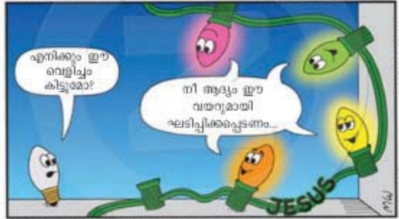
'ഞാൻ ലോകത്തിന്റെ വെളിച്ചം ആകുന്നു. എന്നെ അനുഗമിക്കുന്നവൻ... ജീവന്റെ വെളിച്ചമുള്ളവൻ ആകും'. (യോഹ. 8:12)