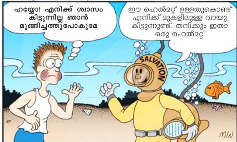
....ശിരസ്ത്രമായി രക്ഷയുടെ പ്രത്യാശയും ധരിച്ചുകൊണ്ടു സുബോധമായിരിക്ക (1 തെസ്സ. 5:8)